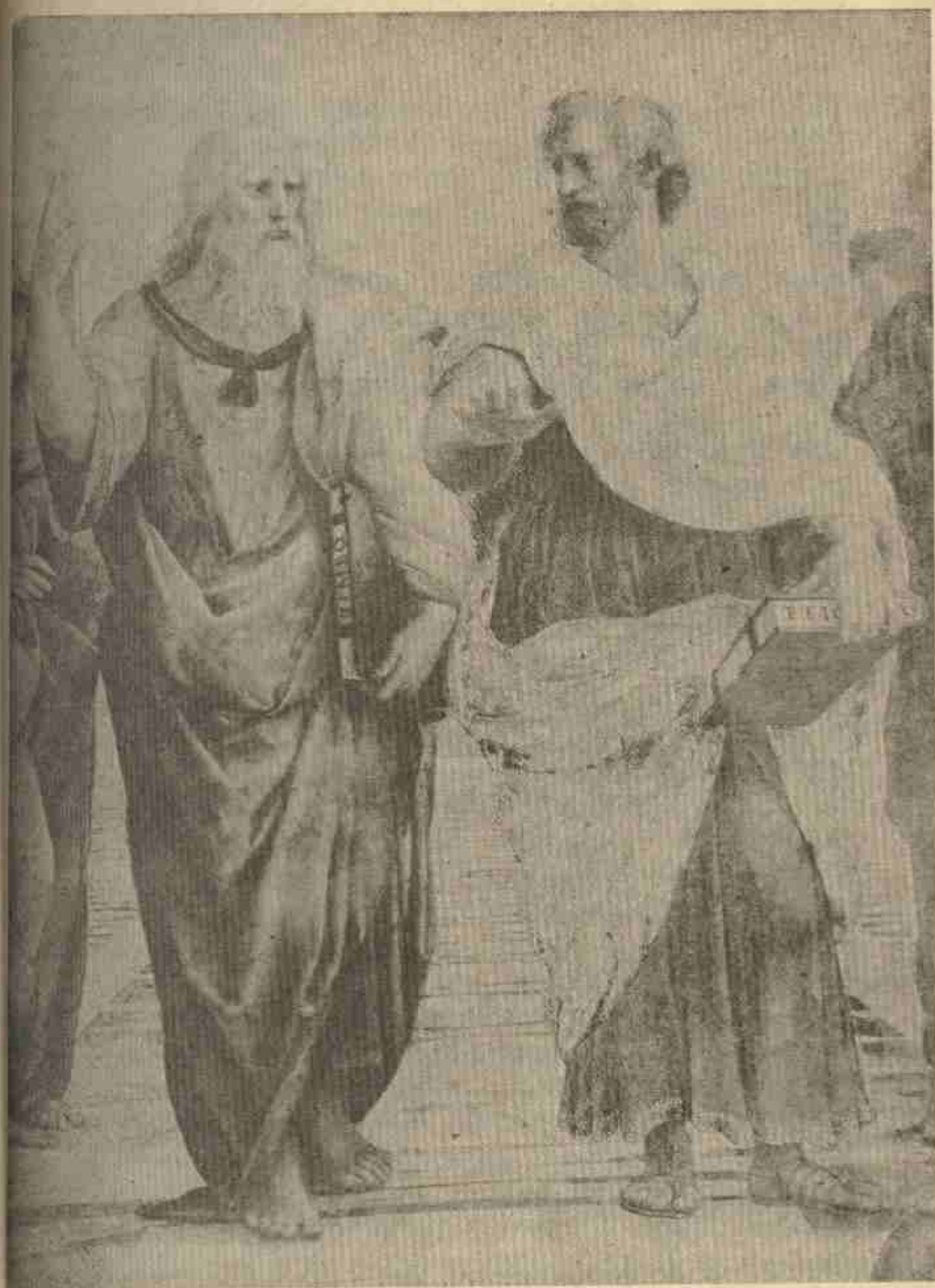
« የአቲና ፡ ትምህርት ፡ ቤት ፡ » (የራፋኤል ፡ ሥዕል ፡ በክፍል ፡ )